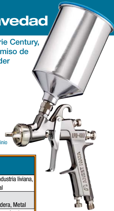
PCG10DM #6034D 1000ml Tanque de aluminio