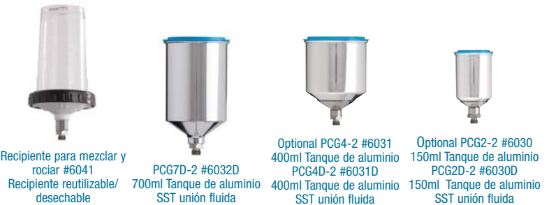
Recipiente para mezclar y rociar #6041 Recipiente reutilizable/desechable

Pistola pulverizadora HVLP de tamaño compacto con poste central alimentado por gravedad y toda la potencia de una pistola de tamaño grande.