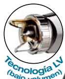
Tecnología LV (bajo volumen)