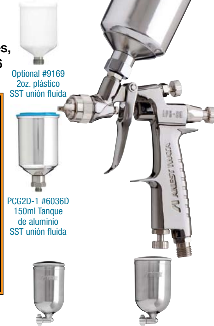
Optional #9169 2oz. plástico SST unión fluida