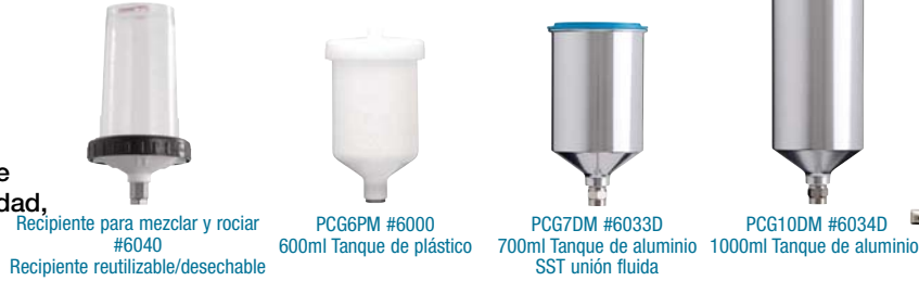
Recipiente para mezclar y rociar #6040 Recipiente reutilizable/desechable

Pistola pulverizadora HVLP (alto volumen - baja presión) de alto rendimiento con poste central alimentado por gravedad, bajo consumo de aire y pulverización superior.